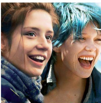
la vida de Adèle